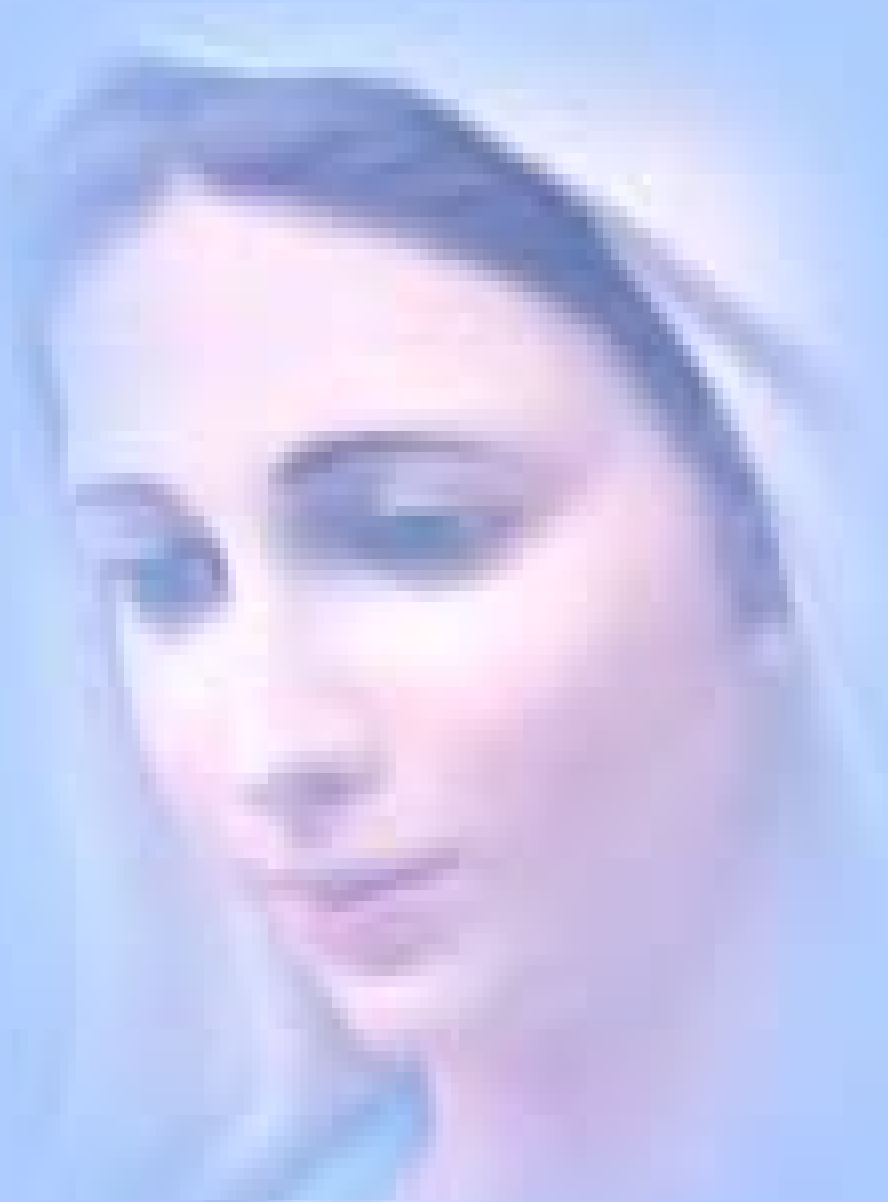
Orędzia Matki Bożej z Medziugorja (1984-2008)